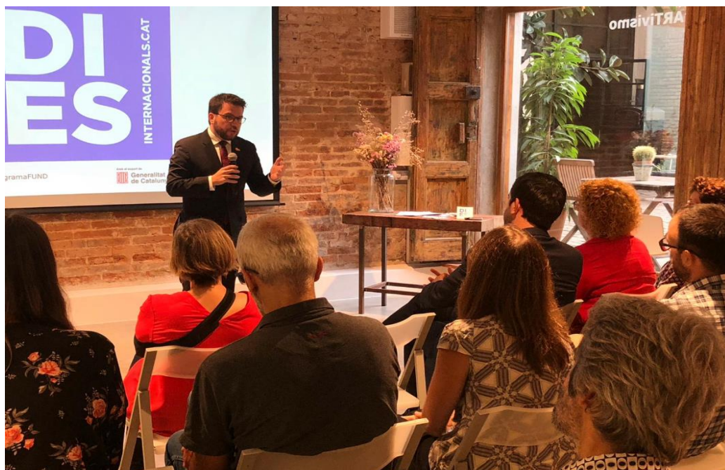
El vicepresident del Govern durant la cloenda de l'acte de presentació de DiesInternacionals.cat

teixit social, de tot el teixit econòmic i professional del nostre país amb causes molt diverses.» «Aquest és un projecte fet des de Catalunya però amb vocació global. Perquè a més es vincula amb l'Agenda 2030. Una Agenda amb la qual, des del Govern, també ens hi sentim compromesos.»